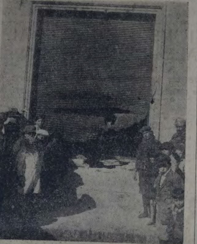
ASPECTO DE LOS DESTROZOS CAUSADOS EN LA PANADERIA DE Coira, en Bernal, por la bomba explotada el jueves y que se supone de origen patronal, como represalia por el hecho de que en esta panadería se vende el pan quince centavos más barato que en los comercios similares.