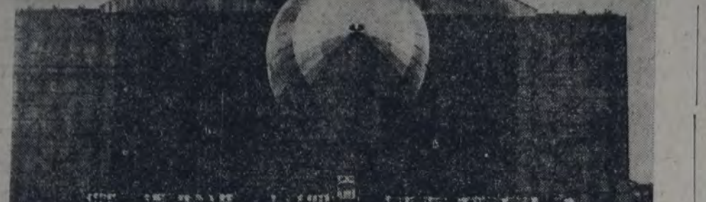
EL DIRIGIBLE "ITALIA" SALIENDO DEL HANGAR, ANTES DE INICIAR SU EXPEDICION.

LONDRES, 9 — Un despacho procedente de King's Bay hace saber que, según noticias recibidas del dirigible