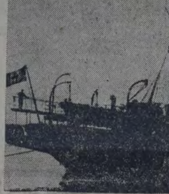
EL VAPOR "CITTA DE MILANO", QUE HA ESTABLECIDO CONTACTO RADIOGRAFICO CON EL DIRIGIBLE "Italia". — Uno de los aparatos salvavidas para el caso de un descenso sobre el mar, de que iba provisto el dirigible.

La aeronave habría lanzado señales SOS coordinadas, que corresponderían a un punto situado a 20 millas al norte