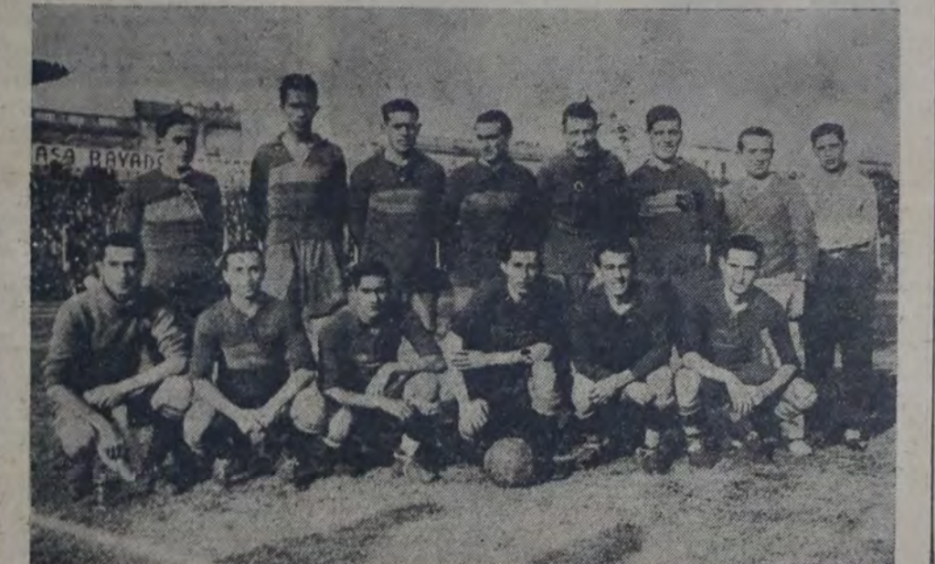
CONJUNTO DEL C. A. BOCA JUNIORS QUE VENCIO POR 2 A 0 AL CUADRO DEL MOTHERWELL F. C. EN el último partido jugado en esta por el equipo de profesionales escoceses.

A partir de este momento, los profesionales situáronse en la ofensiva, hasta la finalización del match, sin conseguir empero variar las cifras del score, debido a la buena actuación de la defensa local.